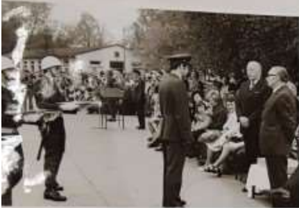
De laatste dag van 1 GGW