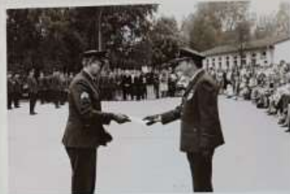
De ex-Commandant 1GGW geeft het commando over het 118 en het 120 squadron over aan C-12 GGW