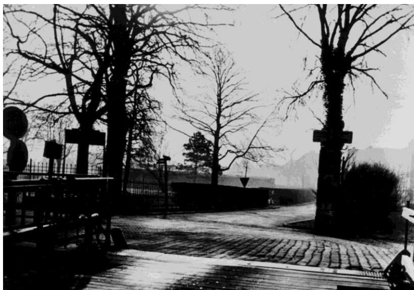
Foto genomen op de Oude Tolbrug, recht door de route die al het personeel moest nemen voor de batterij te bereiken. Links het hek waardoor Maduro met zijn groep villa Dorrepaal bestormde.