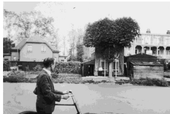
De plek waar de strijd eindigde voor Böinck, op een later tijdstip foto's van de plaats des onheils vastgelegd. De fietser is Böinck zelf.