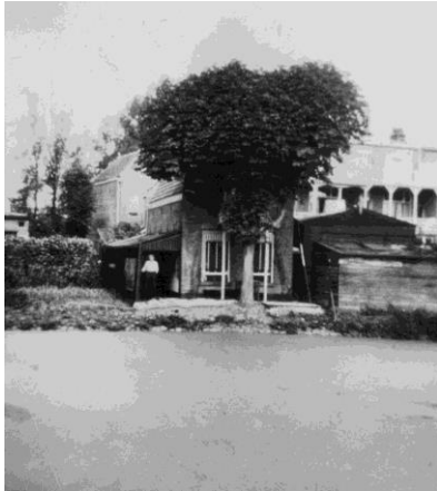
Het huisje aan de 'Oude Tolbrug' aan de Vliet, de boom waarachter Böinck bescherming zocht, maar zwaar werd gewond.

Voor de oud-strijders van de 13 e bt. is het onbegrijpelijk dat hij nimmer is gedecoreerd voor zijn inzet en de gevolgen. Dat kan nog altijd postuum gebeuren!