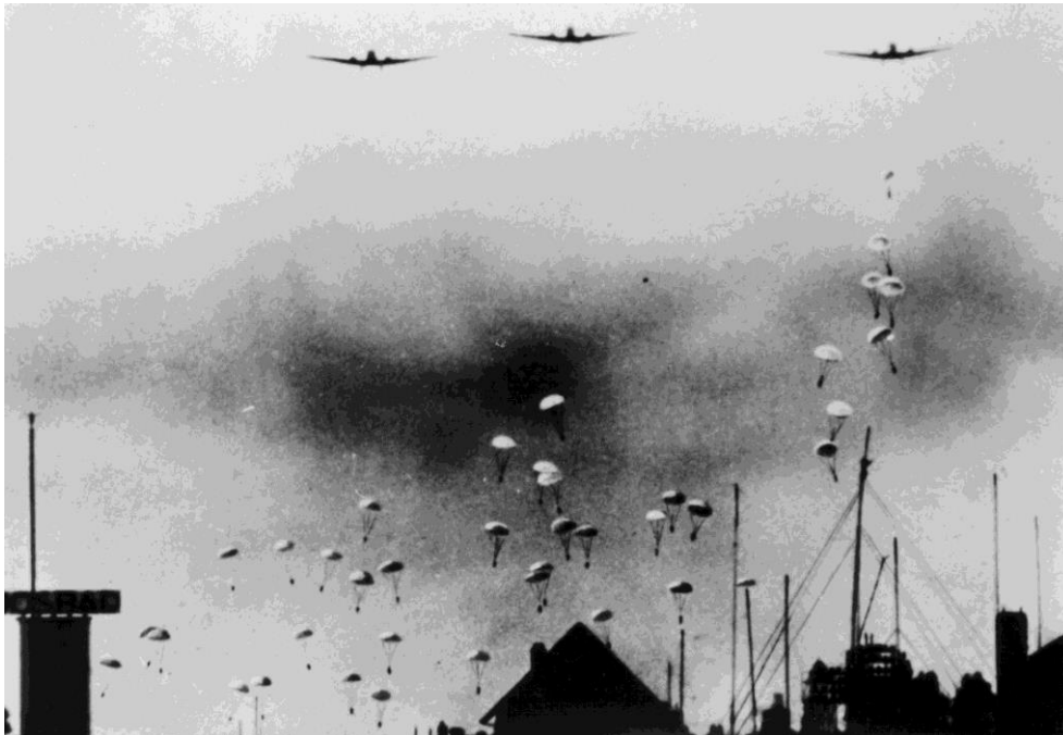
Duitse vliegtuigen werpen para's af