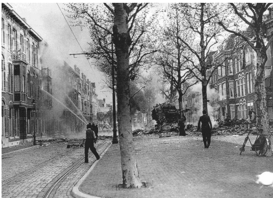
Bluswerkzaamheden in de 2 e Adelheidstraat

Dat eiste van de bemanning zoveel kracht, dat op 11 mei maar drie vuurmonden werden bemand.