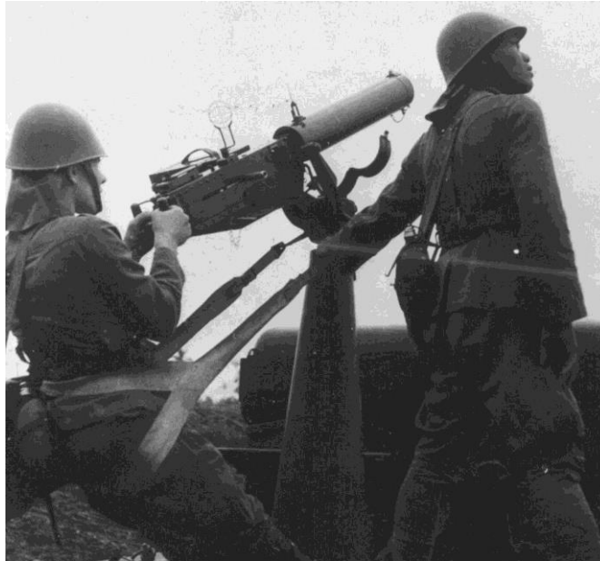
Ook het Koninklijk Nedrlandsch-Indisch Leger (KNIL) was uitgerust met de gehate M-25 mitrailleur