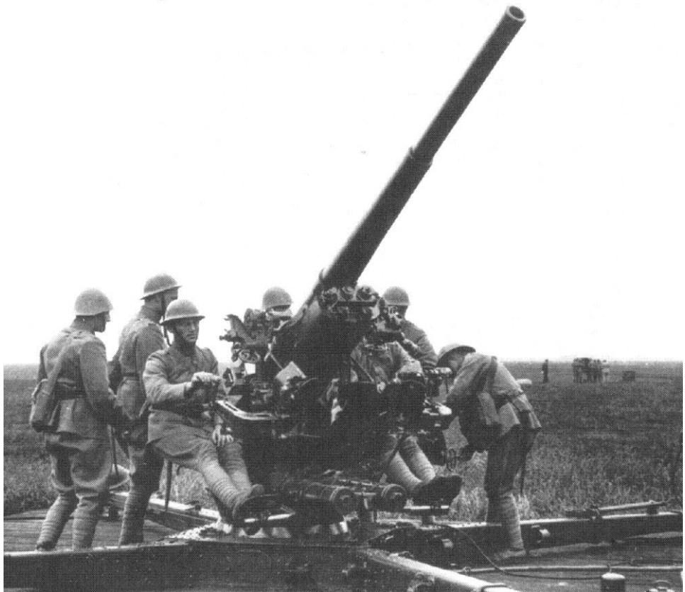
Het type kanon (Vickers 7,5 cm) waarbij vijf mannen van 13 Bt. Lua de dood vonden

Hoe moeilijk het was om de strijd voort te kunnen zetten blijkt uit de gegevens over de voorraden in de munitiemagazijnen.